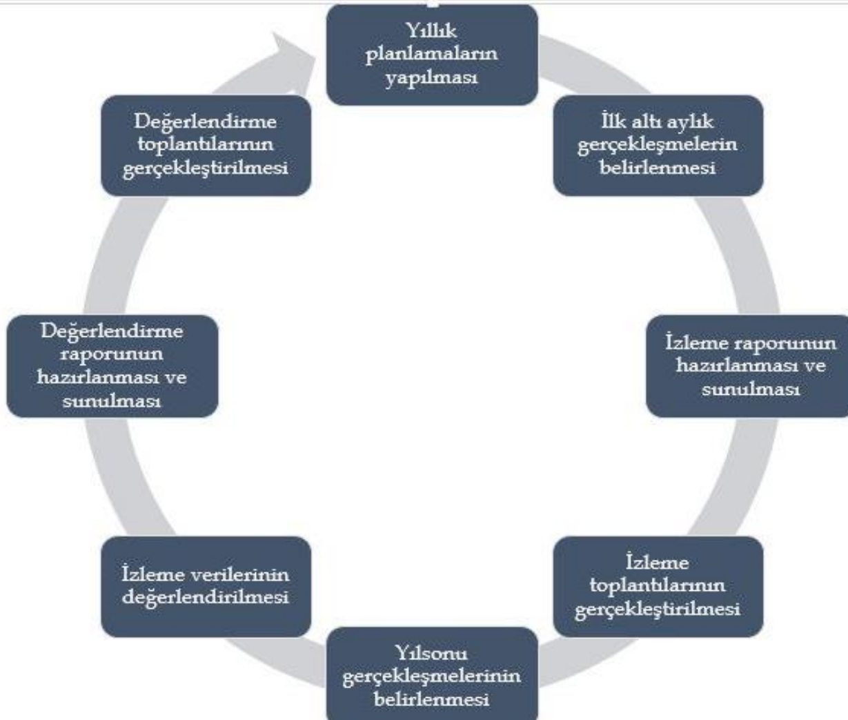
Şekil 5: İzleme ve Değerlendirme Süreci