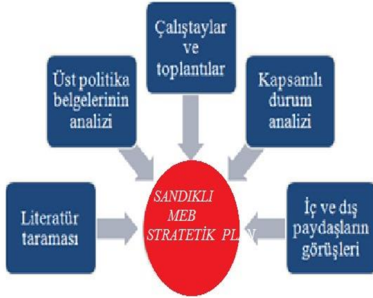
Şekil 1:Stratejik Plan Hazırlama Şeması

21. yüzyıl bilgi toplumunda yönetim alanında yaşanan değişimler, kamu kaynaklarının etkili, ekonomik ve verimli bir şekilde kullanıldığı, hesap verebilir ve saydam bir yönetim anlayışını gündeme getirmiştir. Ülkemizde de kamu mali yönetimini bu anlayışa uygun olarak yapılandırmak amacıyla 5018 Sayılı Kamu Mali Yönetimi ve Kontrol Kanunu uygulamaya konulmuştur. Kanun kamu idarelerine kalkınma planları, ulusal programlar, ilgili mevzuat ve benimsedikleri temel ilkeler çerçevesinde geleceğe ilişkin misyon ve vizyonlarını oluşturma, stratejik amaçlar ve ölçülebilir hedefler belirleme, performanslarını önceden belirlenmiş olan göstergeler doğrultusunda ölçme ve bu süreçlerin izlenip değerlendirilmesi amacıyla katılımcı yöntemlerle stratejik plan hazırlama zorunluluğu getirmiştir. İlçemizde de ilk stratejik planını 2010-2014 ikincisini ise 2015-2019 yıllarını kapsayacak şekilde hazırlamış ve uygulamıştır.