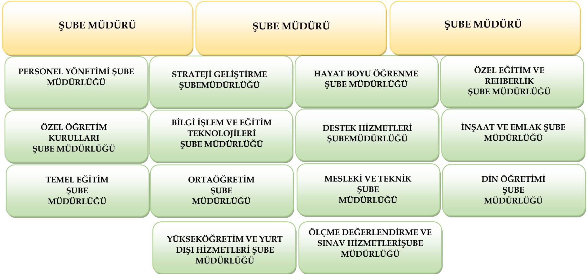
Şekil 4: İlçe Millî Eğitim Müdürlüğü Teşkilat Şeması